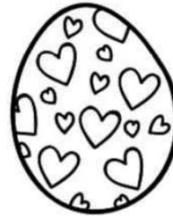
22/03-24/03 Scoutsweekend!! JIPPIEE:))