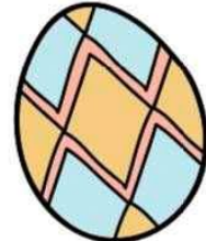
31/03 Pasen geen scouts